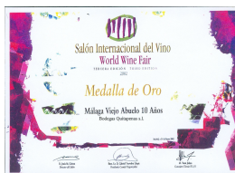
Medalla de Oro Salón Internacional del Vino 2002