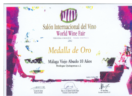
Medalla de Oro Salón Internacional del Vino 2002